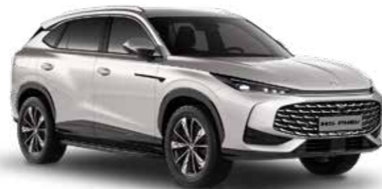
Sterling Silver Μεταλλικό χρώμα