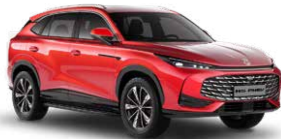
Diamond Red Μεταλλικό χρώμα