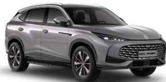
Hampstead Grey Μεταλλικό χρώμα