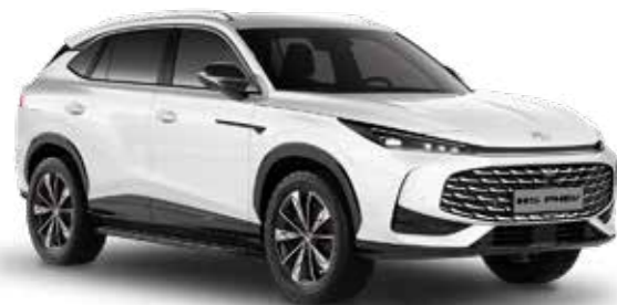
White Pearl Μεταλλικό χρώμα