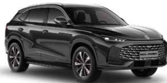
Pebble Black Μεταλλικό χρώμα

Ορισμένοι από τον εξοπλισμό που αναφέρεται και παρουσιάζεται σε αυτό το έγγραφο είναι στάνταρ μόνο σε ορισμένα επίπεδα εξοπλισμού.