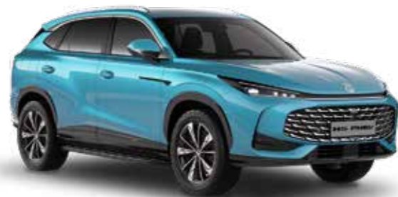
Arctic Blue Μεταλλικό χρώμα